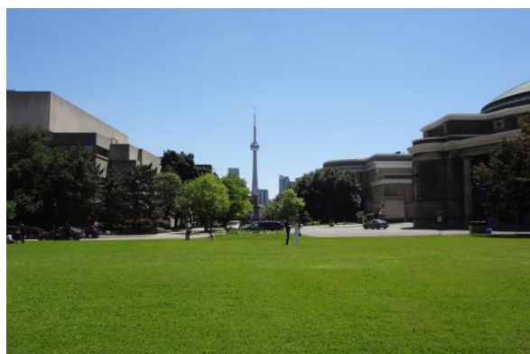
トロント大学構内

私が派遣先として選んだのはトロント大学の Hoi-Kwong Lo 教授の研究室でした。私の修士課程の研究がその先生の理論をベースにしたものであったことと、またその先生が現指導教官と知人であったことが動機となりました。トロント大学は学生数5万弱を抱える巨大な大学で、そのうち留学生が約20%[1]を占めます（東大は学生数3万で留学生約8%[2]）。私の周辺では特に中国からの留学生が多く、英語と同じくらい多く中国語を耳にしました。多文化な構造は大学だけではなく、都市全体に広がっています。街の中心には大きな中華街があり、他にも韓国人街、イタリア人街、ギリシャ人街等が連なっています。それぞれの民族が自国の文化を崩すことなく生活しており、トロントは「人種のるつぼ」ではなく「文化のモザイク」都市と呼ばれています。世界中から集まった様々な人が誇りをもって自国の文化を語り合える魅力的な都市です。