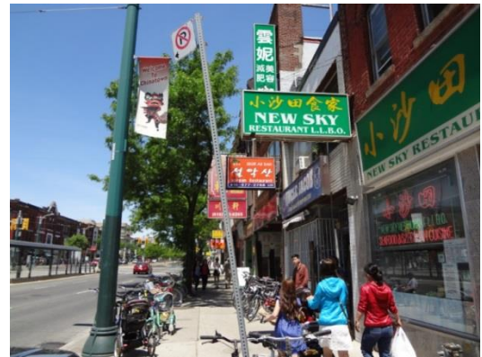
Chinatown in Toronto

What was a fan in a day was lunch time. I went to the China town which is near University of Toronto with Chinese members. The members of the lunch do not depend on research groups and they ask various kinds people to eat out together, which impressed me.