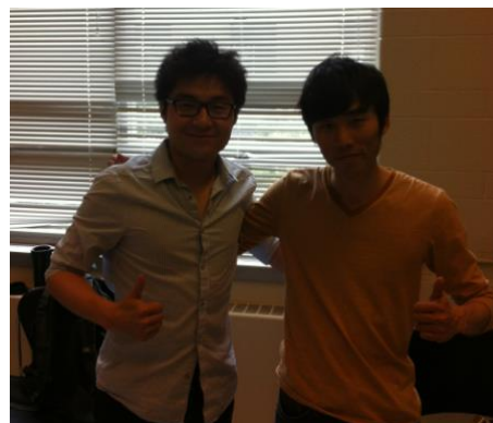
お世話になった先輩と

私が到着したころ、派遣先の研究室ではちょうど新しいプロジェクトが始まったところで、そのプロジェクトに私も参加させていただけることになりました。ただ派遣前に紹介されていたプロジェクトとは全く異なるものだったので、背景の勉強等は一からということになりました。初めの一ヶ月程度でプロジェクトの主旨を理解し、その後は先輩の協力のもと、論文の第二著者としての役割を果たしました。研究期間が3ヶ月という限られた期間であり、またプロジェクトの都合上迅速に結果を