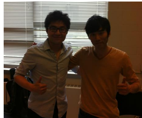
With a research member