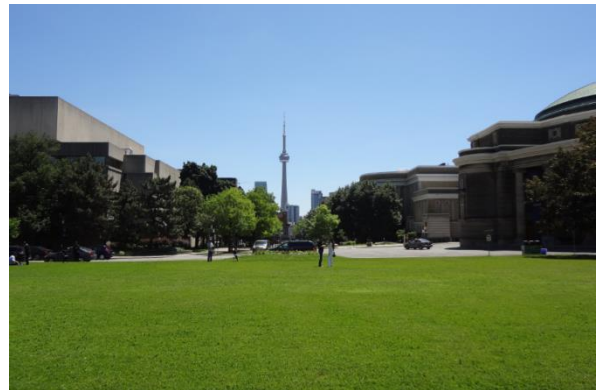
University of Toronto